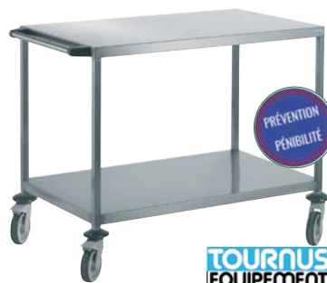
Table mobile multiservice inox 2 plateaux 2 plateaux lisses dimensions utiles : 100 x 60 cm. Espace entre plateaux 57 cm. Poignée horizontale qui libère toute la surface. Charge maximale : 100 kg par plateau. 4 roues pivotantes ø 125 mm dont 2 à frein.