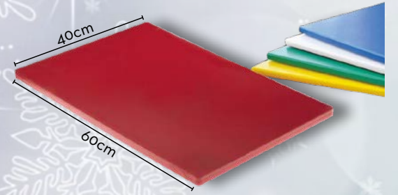
Planche à découper avec code couleur conforme à la démarche HACCP : une couleur pour chaque type d'aliments.